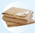
Сдвоенное одеяло (летнее и зимнее) Размер 200×230