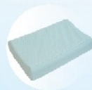
2 подушки Размер 60×40×12