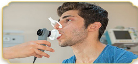
СНИЖЕНИЕ КАРДИОРЕСПИРАТОРНОЙ ФУНКЦИИ